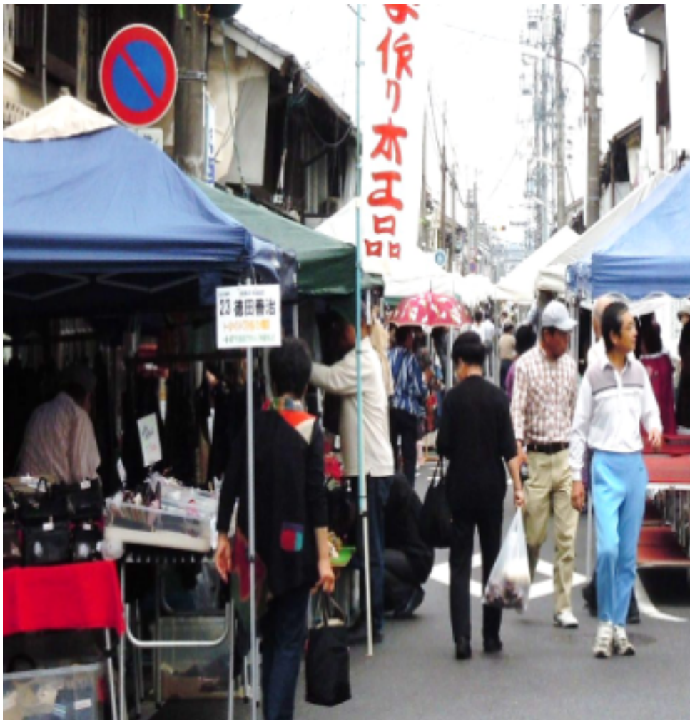
「津山・城西まるごと博物館フェア2010」